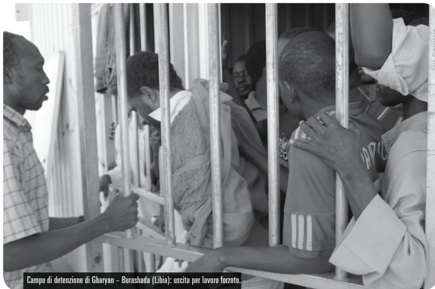
Campo di detenzione di Gharyan - Burashada (Libia): uscita per lavoro forzato.

Nel 2011 la Libia si è ritrovata al centro della scena internazionale per la rivoluzione frutto della primavera araba e la caduta di Gheddafi. E', però, meno conosciuta per il suo ruolo attivo nella gestione delle migrazioni, in stretta collaborazione con l'Unione europea (UE).