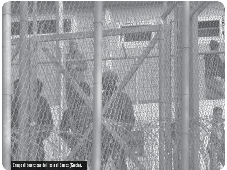
Campo di detenzione dell'isola di Samos (Grecia).

Fulcro della politica di immigrazione e asilo, la detenzione dei-delle stranieri-e si sviluppa oggi in maniera inquietante. I campi, dispositivi emblematici della marginalizzazione delle popolazioni giudicate indesiderabili, sono teatro di numerose violazioni dei diritti fondamentali.